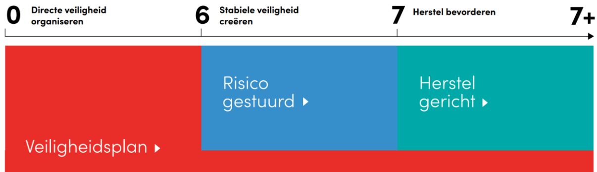
Figuur 1 Model Visie gefaseerd samenwerken aan veiligheid (Civil Care et al., 2021)

De opbouw van het normenkader is gebaseerd op het model binnen de Visie gefaseerd samenwerken aan veiligheid (Civil Care et al., 2021). De ambitie is om een verschil te maken bij het doorbreken van de complexe cirkel van geweld die doorwerkt tot in de volgende generatie. In het model wordt uitgegaan van verschillende elementen waaraan gewerkt moet worden in het aanbieden van zorg, verdeeld over drie fasen: